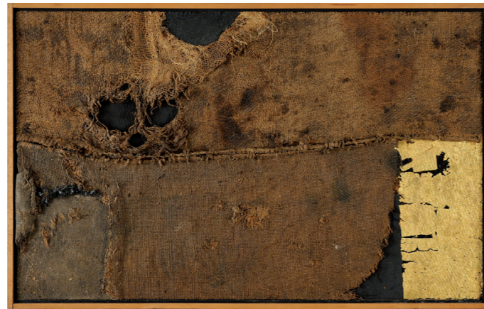
Alberto Burri, Sacco ST 11 , 1954, Città di Castello, Fondazione Palazzo Albizzini Collezione Burri

A queste serie di grandi opere Burri affianca la produzione di opere grafiche di pari intensità e forza cromatica. La mancata realizzazione della committenza Gardini, coordinata dall'architetto Moschini, non gli impedisce di appassionarsi ad una pittura evocativa della grande stagione musiva dell'arte bizantina, copiosamente presente in città, nelle chiese e negli edifici storici decorati a mosaico. Nascono i cicli dei dipinti Nero e Oro (1993) che si ispirano alla cultura di alta decorazione fiorita a Bisanzio e sviluppatasi nella città di Ravenna con