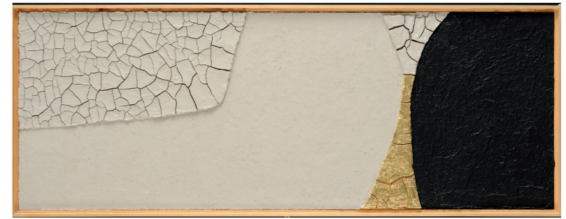
Alberto Burri, Cretto Nero e Oro, 1994, Città di Castello, Fondazione Palazzo Albizzini Collezione Burri

The approximately one hundred works on display at the exhibition also include examples that allowed Burri to win the Lincean Academy National Award for Graphics (1973). In this sense, the two areas of his painting and graphic production, supplemented by the presence of the large red sculpture, Grande Ferro R (1990), which is on display at the 'Mauro De André' Palace of Arts and Sports, offer a broad overview of the works by the Maestro from Città di Castello in his beloved Ravenna.