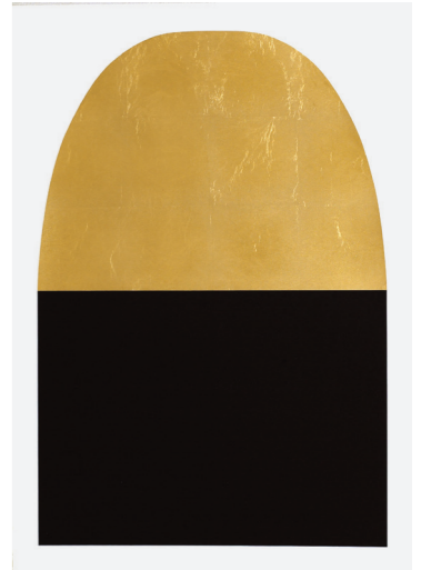
Alberto Burri, Trittico , 1994, particolare Cartella di 3 serigrafie e foglia d'oro Carta Fabriano rosaspina cm. 100x70 Stamperia fausto Baldessarini, Fano Città di Castello Fondazione Palazzo Albizzini Collezione Burri

La mostra è realizzata in collaborazione con la Fondazione Palazzo Albizzini Collezione Burri di Città di Castello, con l'Archivio FFMAAM | Fondo Francesco Moschini A.A.M. Architettura Arte Moderna Roma, grazie al prezioso sostegno del Progetto del Ministero del Turismo per la valorizzazione di Ravenna Città del Mosaico, della Regione Emilia-Romagna, della Fondazione Gardini, della Fondazione del Monte di Bologna e Ravenna, di Romagna Acque Società delle fonti e di Vernice s.r.l.